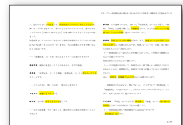
発言ローデータ報告書作成 (オプション)